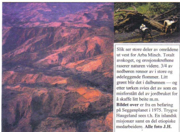
Slik ser store deler av området ut vest for Arba Minch. Totalt avskoget, og erosjonskreftene raserer naturen videre. 3/4 av nedbøren renner av i store og ødeleggende flommer. Litt grønt blir det i dalbunnen — og etter tørken svies det av som en misforstått del av jordbruket for å skaffe litt beite m.m. Bildet over er fra en befaring på Seggenplanet i 1975. Trygve Haugeland sees t.h. En islandsk misjonær samt en del etiopiske medarbeidere.