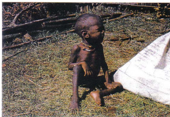
Utsultet barn i Mega i Syd-Etiopia 1974. Tørrmelksekk til høyre