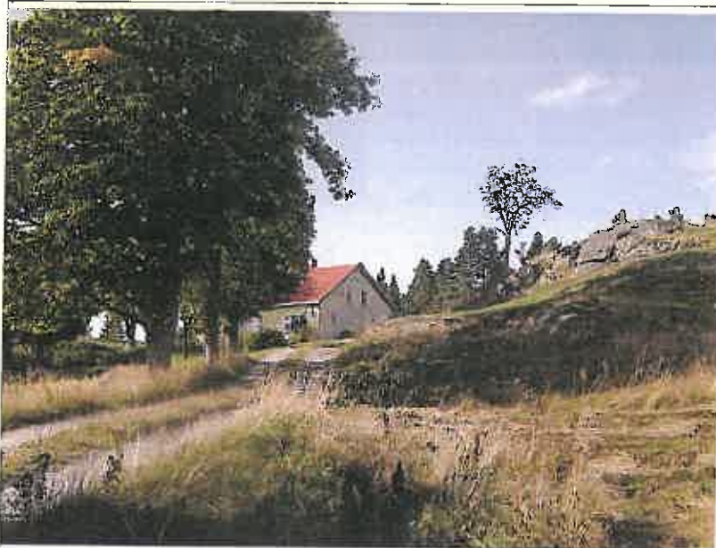
Garden Skripeland i Iveland i Aust Agder hvor de 20 bønderne ble satt i arrest - delvis i jern. De ble dømt i Høyesterett til vann og brød.

Da Norge enda var i union med Danmark, ble den såkalte Konventikkelplakaten innført i 1741. Den ga prestene retten til å kontrollere det meste av religiøse møter, og var ment å være en sikring mot vranglære. Dessverre ble den et stort hinder mot lekfolkets kall, forkynnelse og vekkelse som skulle fornye og gjenreise folket og landet vårt til en fri, velordnet velstands- og misjonsnasjon. Selv om loven både ble mistolket og ikke hadde noe straffeparagraf, ble den et kraftig våpen i hendene på presteskabet og embetsverket mot Hans Nielsen Hauge og hans venner.