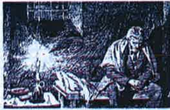
Var det Gud's mening at han skulle som det utroste det lyst og livet senere at den vaker han hadde tjene?

Over t.v.: Hans Nielsen Hauge mottar kallet i 1796 — senere i fengsel fra 1804.