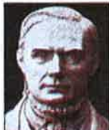
Hans Nielsen Hauge (1781 - 1842)