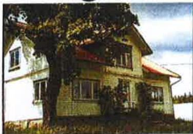
JØRGEN LØVLAND 1848 - 1921