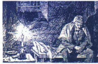
Var det Guds mening at han skulle sette her utroenig? (se Lynt og Isret senere at den stiden han hadde tigger?)

Over t.v.: Hans Nielsen Hauge mottar kallet i 1796 — senere i fengsel fra 1804.